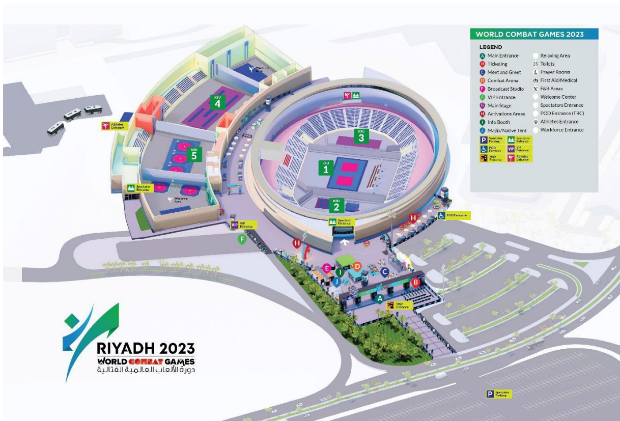
Stade couvert de l'université King Saud (KSU)

Il y a encore eu une cérémonie de clôture officielle de la WCG. Comme nous avons notre transport de retour à l'hôtel, tout le monde n'a pas pu y assister. Nous sommes partis pour l'aéroport à 22 heures déjà.