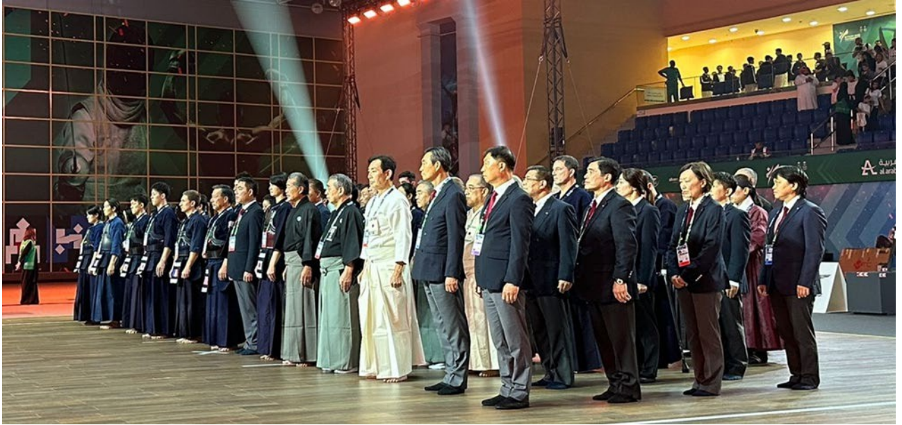
Cérémonie d'ouverture à la King Saud University (KSU).

Toutes les salles de sport étaient très bien équipées. Le sol spécial posé était top, sauf la zone de warm up, qui était assez glissante.