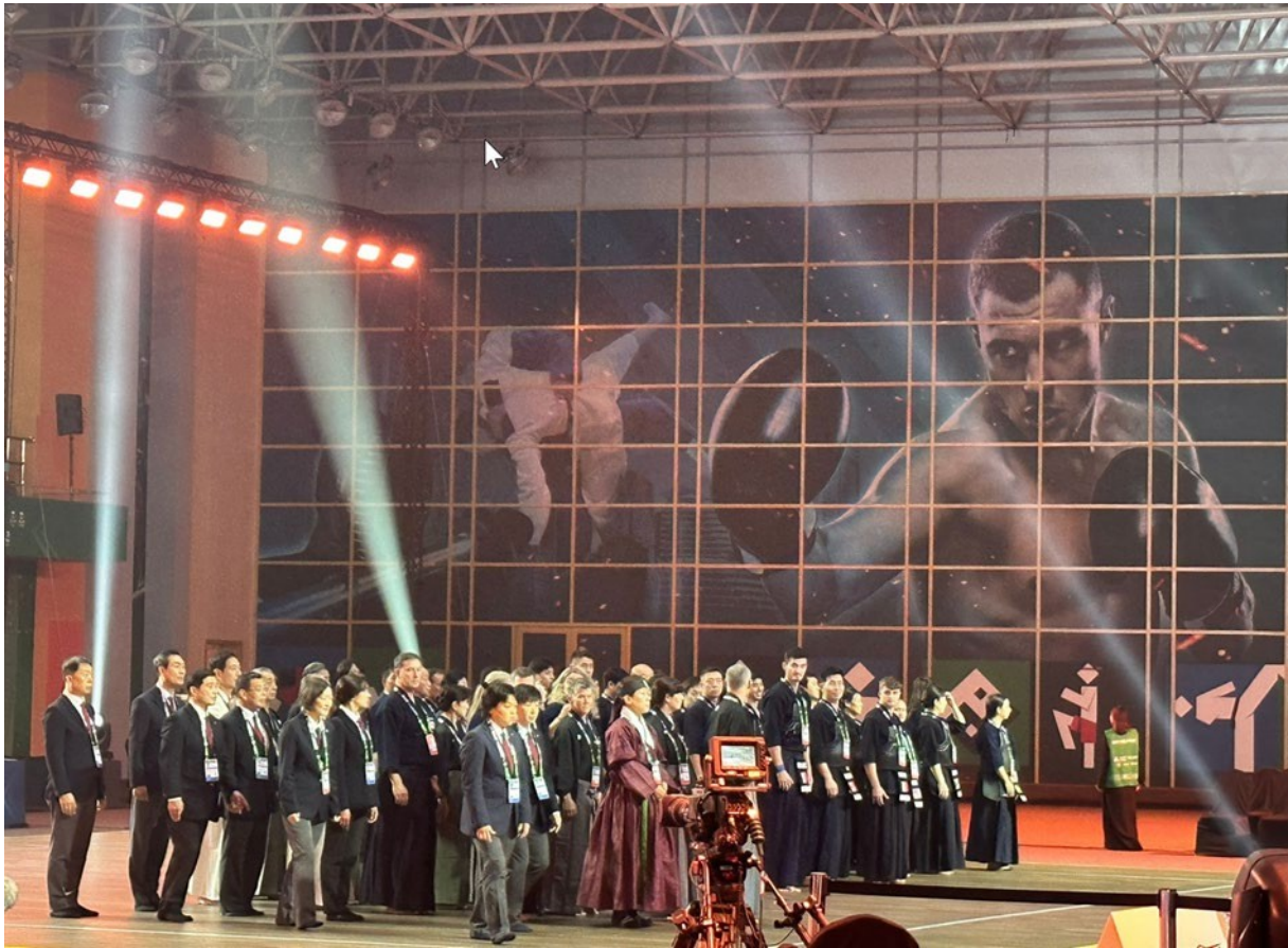
Cérémonie de clôture du kendo

Il y a encore eu une cérémonie de clôture officielle de la WCG. Comme nous avons notre transport de retour à l'hôtel, tout le monde n'a pas pu y assister. Nous sommes partis pour l'aéroport à 22 heures déjà.